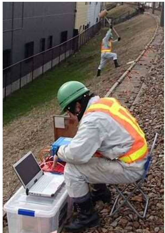
図1 高精度表面波探査

応用地質(株)が開発し販売しているツールである(図1)。地盤の地表付近を伝わる表面波(レイリー波)を多チャンネルで測定・解析することにより深度20m程度までの地盤の S 波速度を二次元断面として画像化する技術である。素早く低コストで S 波速度構造を求めることができる。