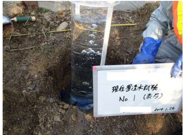
図3 原位置透水試験

実測した透水係数 K を用い、目標とする降雨量で地下水位をシミュレーションする。そのうえで、実測した c \cdot \phi を用いて安定解析を行う。このとき、 c \cdot \phi のばらつき（標準偏差）を与えることで、統計的な計算をおこない、安全率 F_s < 1.0 となる頻度をもって崩壊確率 PF (Probability of Failure) を算出する。