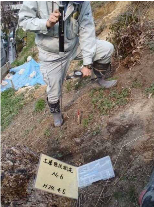
図2 土層強度検査棒

土木研究所が開発した簡易な地盤調査器具である（図2）。コーンを突き刺して土層深を得、上載荷重を掛けつつベーンコーンを回して、 c \cdot \phi を得る。 c \cdot \phi は三軸圧縮試験結果との相関関係から導くため精密さにはやや欠けるが、数多くの計測が可能で強度のばらつきを統計的処理に導くことができる。精度よりも、数で勝負という考え方である。